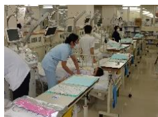
トリアージカードを渡す