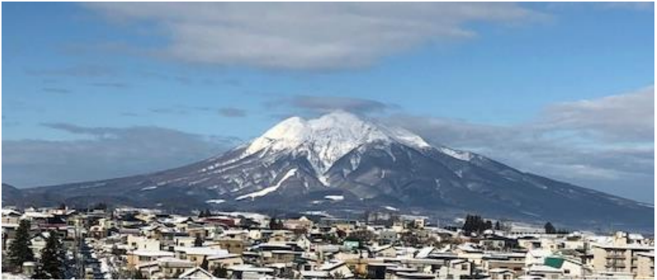
2019年12月30日撮影の岩木山