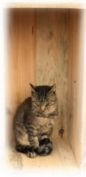
りんご箱のねこちゃん