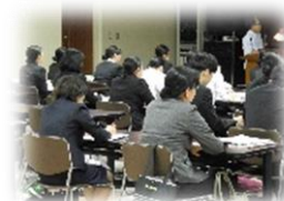
黒石高等学校専攻科 学生 実習2018/10/5