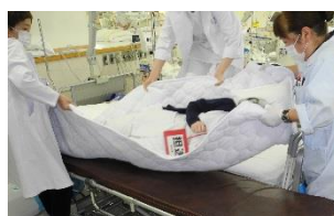
自力で避難できない患者さんを搬送①