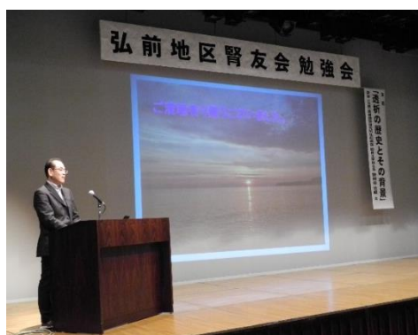
勢州谷技士長の講演