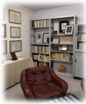
院内6階 故元理事長メモリアルルーム