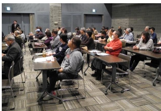
聞き入る参加者の皆さん