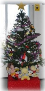
院内のクリスマスツリー