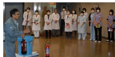
消火器の使い方の説明を受ける