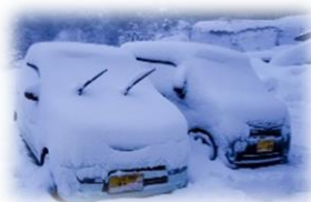
あっという間の大雪・駐車場