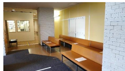
工事期間中の仮待合室