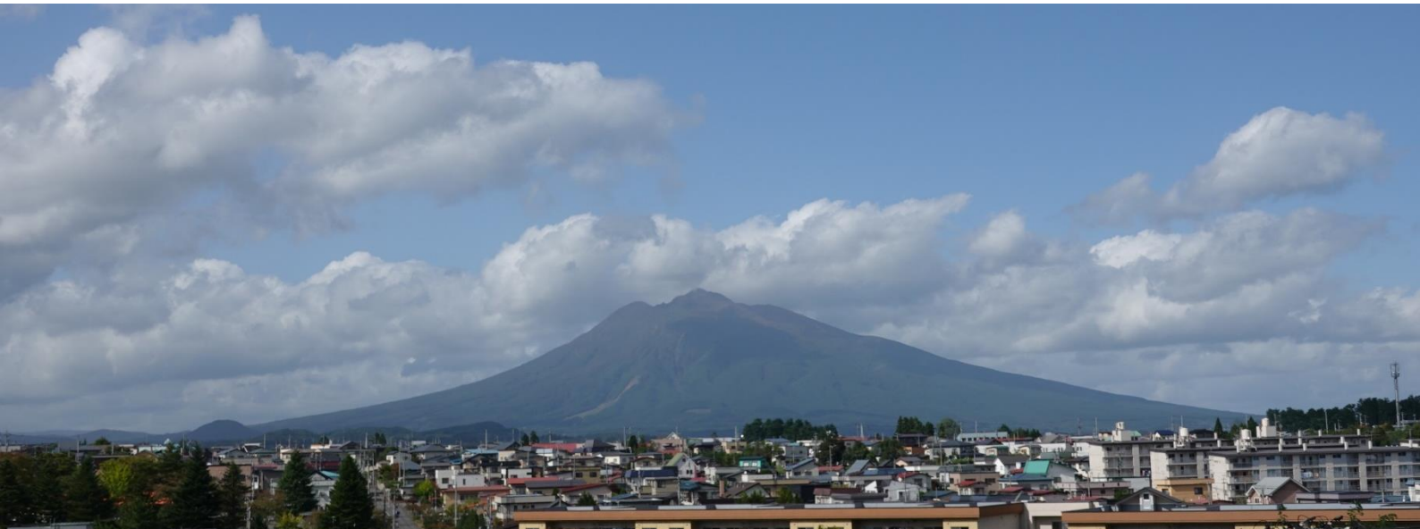
鷹揚郷からの岩木山 10月5日撮影