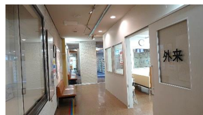
工事期間中の仮外来