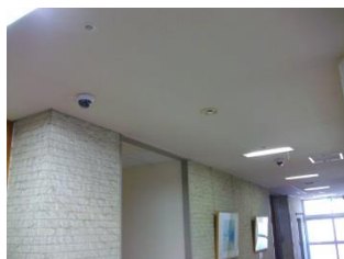
正面玄関、救急出入口

現在ではほとんどの施設が防犯カメラを設置していると言えます。治安が悪くなった現代、防犯カメラは犯罪防止や事件解決に大きな役割を果たす設備だと思います。レコーダーに保存された画像などは事件等が発生した場合のみ使用し、外部へ流出することが無いよう管理いたします。