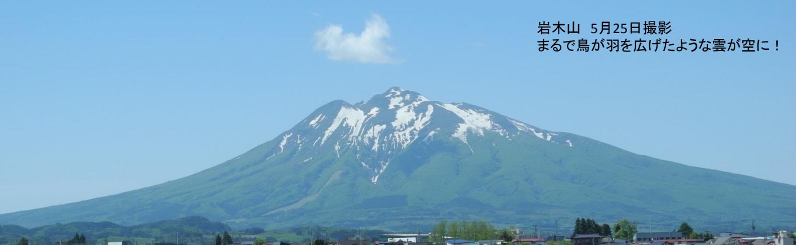
岩木山 5月25日撮影 まるで鳥が羽を広げたような雲が空に！