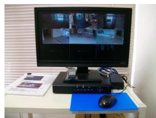
モニター・レコーダー 医事課